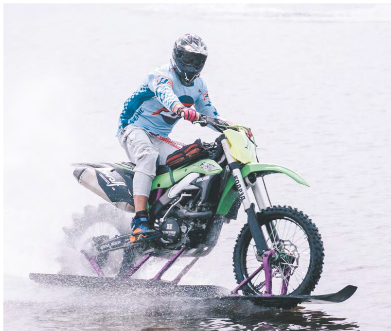
▲ В уральской столице объявили полную программу третьего фестиваля мотоциклетной культуры, музыки и спорта «Движение»