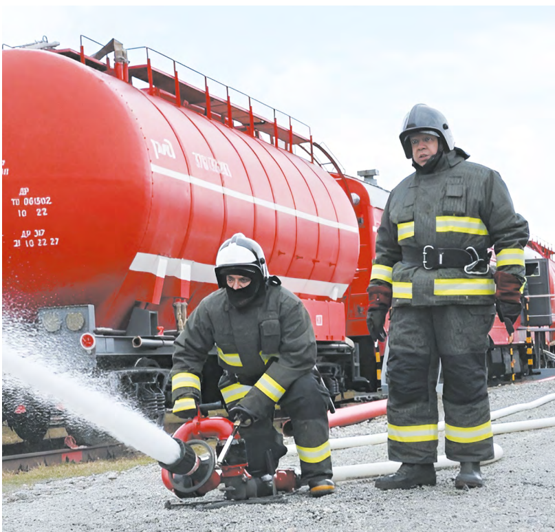
▲ Поезда на страже лесов: СВЖД подготовила технику к пожароопасному сезону