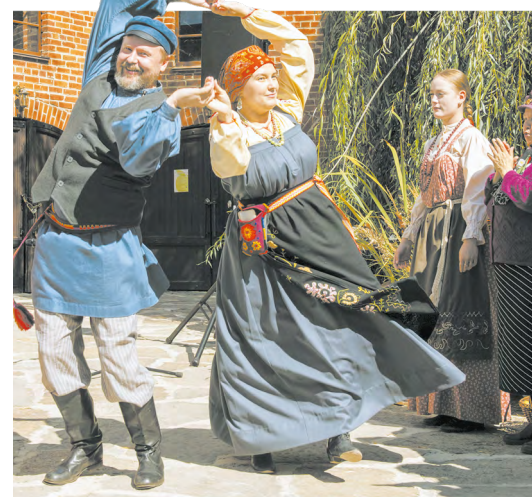
Сменить привычные джинсы и блузки на сарафаны и старорусские рубахи и пуститься в пляс — люди ценят возможность хоть на короткое время, но отправиться в прошлое