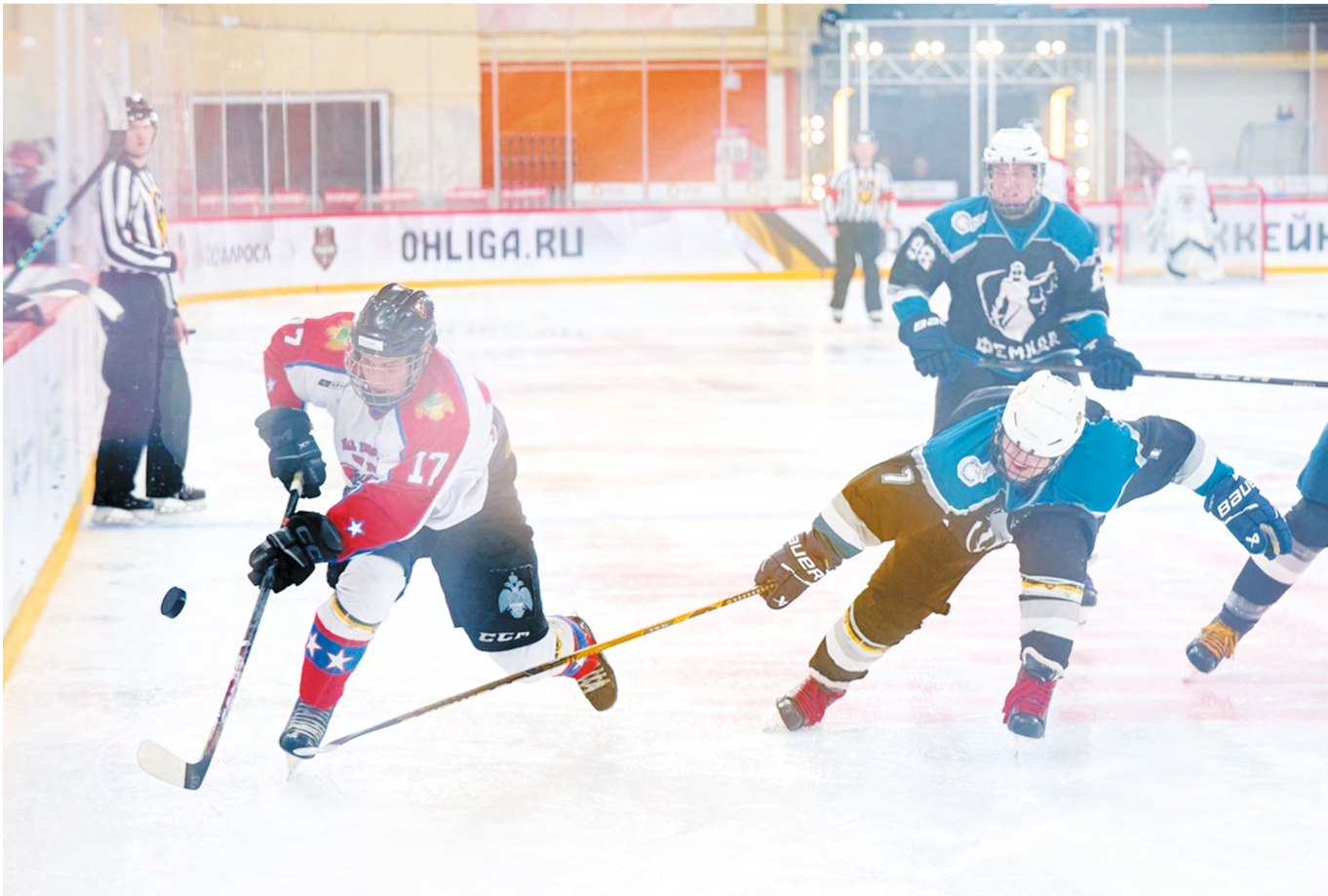
▲ Свердловская область подвела итоги регионального этапа «Офицерской хоккейной лиги»