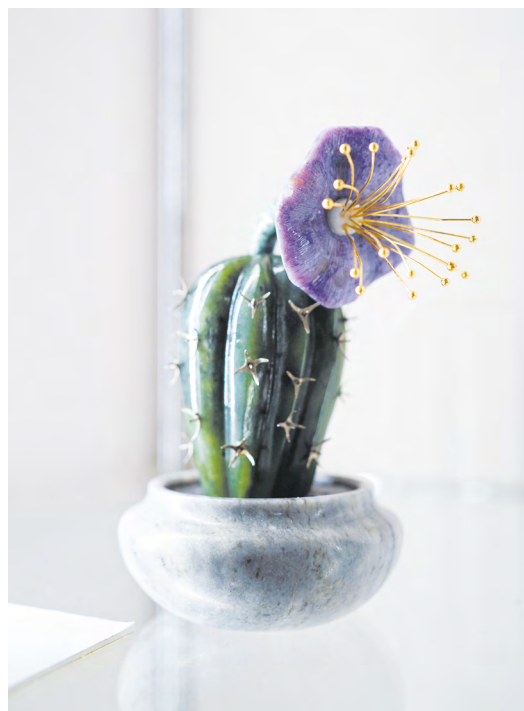
▲ В Екатеринбургском музее изобразительных искусств открылась выставка «Самоцветы Сибири»