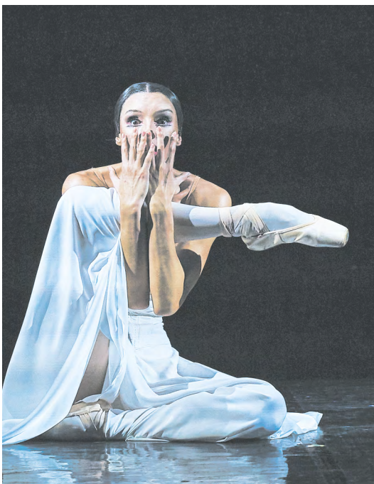
▲ Уралцы увидели «Красную Жизель» Театра балета Бориса Эйфмана