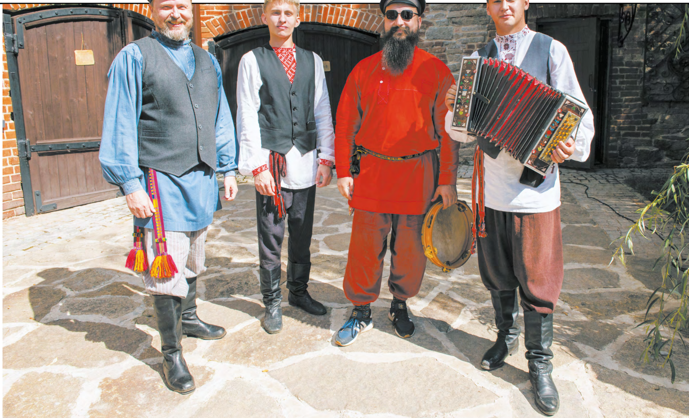
Как работать с традицией: бережно консервировать или смело адаптировать? Для неравнодушных к старине фольклористов это не противоречие. Благодаря оригинальному подходу им удалось найти путь, который позволяет возрождать интерес людей к своему давнему прошлому!