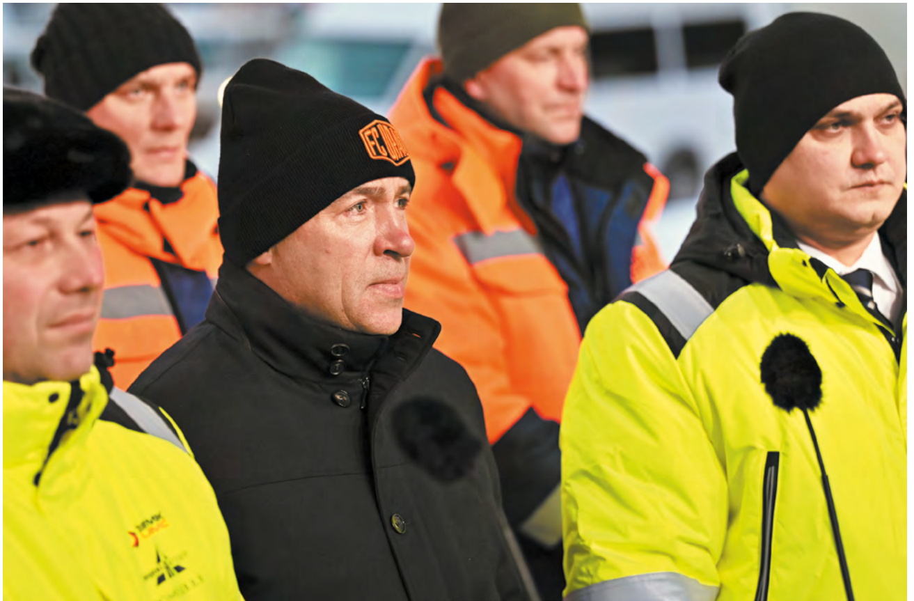
▲ «Дорожное строительство приносит массу плюсов. Это экономическое развитие, комфортность передвижения, безопасность», — сказал Евгений Куйвашев после церемонии ввода участка автодороги Р351 Екатеринбург – Тюмень под Талицей, проведенной президентом Владимиром Путиным.