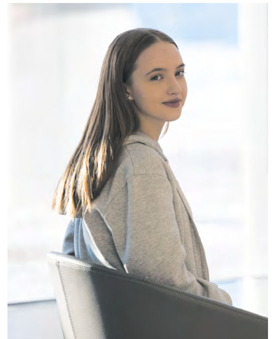
▲ Губернаторские стипендии получили лучшие студенты и аспиранты Свердловской области.