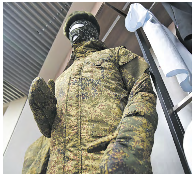
▲ На первой цифровой швейной фабрике SHISHKIN uniform atelier презентовали военную форму нового образца.