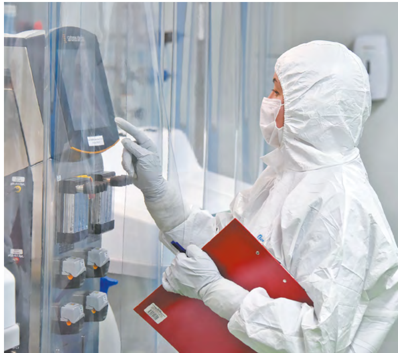
Новоуральский завод «Медсинтез» производит лекарства от бесплодия.

Какие есть пути решения проблемы? Первый — выведение препарата в разряд дефектурного. Как известно, цена начинает расти, если есть риск «пустых полок». Но здесь встает вопрос сроков — в дефиците лекарство вечно быть не может, а значит, и стоимость его будет нестабильной.