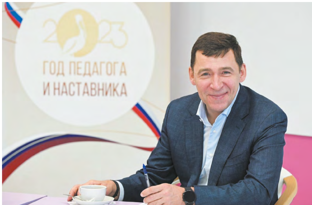
В новом современном здании школы №3 Евгений Куйвашев рассказал красноуфимским учителям о мерах поддержки педагогического сообщества

Евгений Куйвашев во время личного приема граждан рассказал еще об одной возможности для молодых учителей