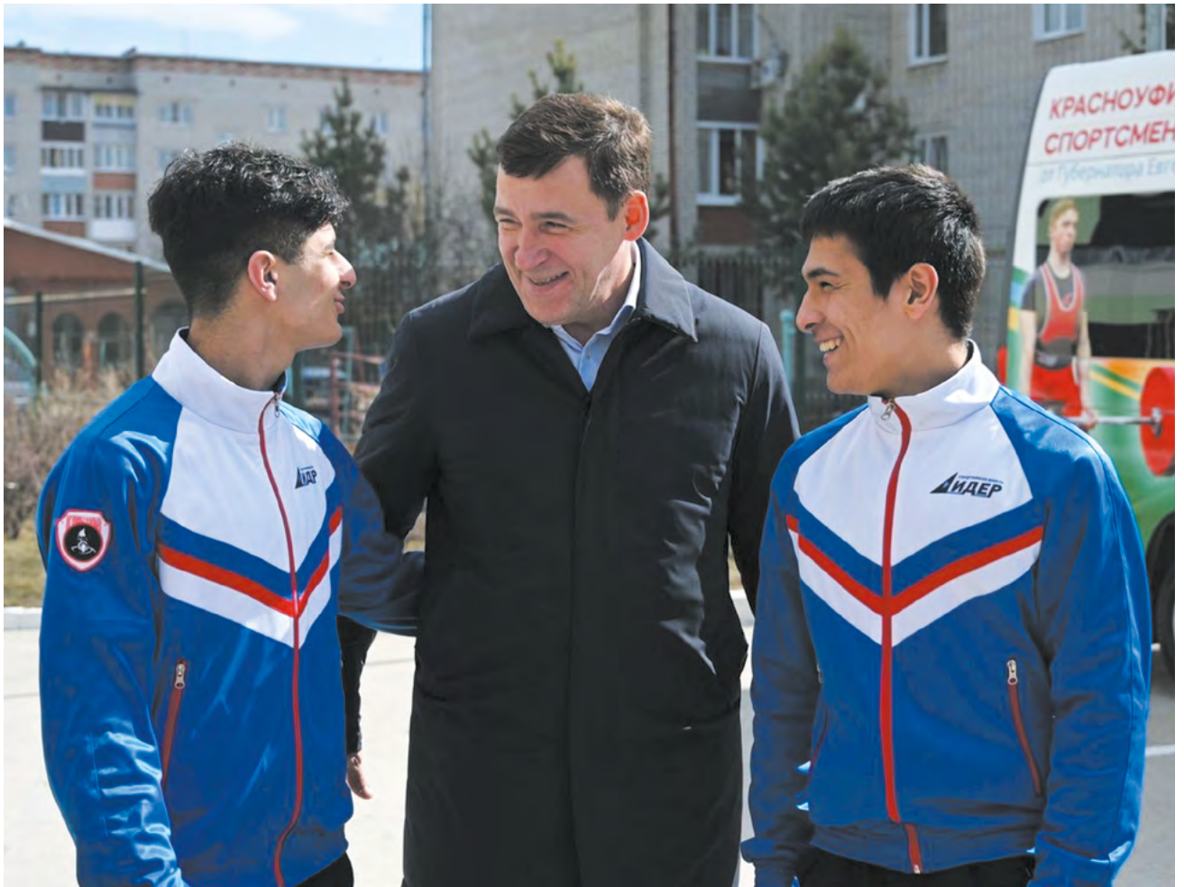
▲ Евгений Куйвашев передал воспитанникам спортшколы в Красноуфимске автобус для выезда на соревнования.