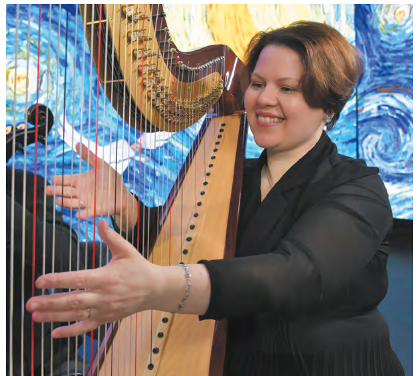
▲ В 2023 году концерты фестиваля «Безумные дни» объединит тема «Ода ночи».