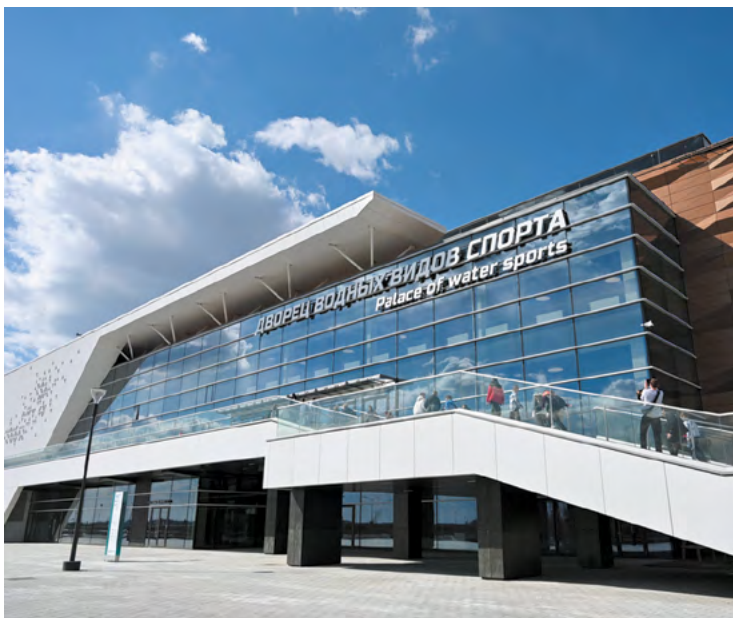
▲ Дан старт работе крупнейшего в стране Дворца водных видов спорта.