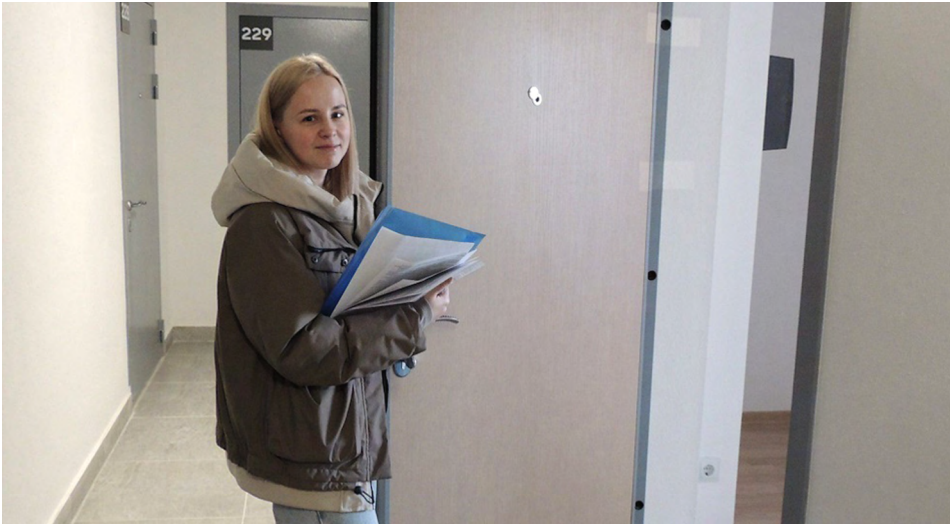
Они по несколько лет ждут своей очереди, и искренне рады, когда подходит их черед получить долгожданную квартиру!

ПРЕДЪЯВИТЕ ДОКУМЕНТЫ! Дети-сироты, проживающие по договору соцнайма в государственных квартирах, могут оформить их в собственность через процесс приватизации. Для этого необходимо собрать соответствующие документы и подать заявление в фонд жилищного строительства Свердловской области. Дополнительную информацию о документах и порядке подачи заявления можно получить по телефону: +7 (343) 312-00-35 (доб. 62).