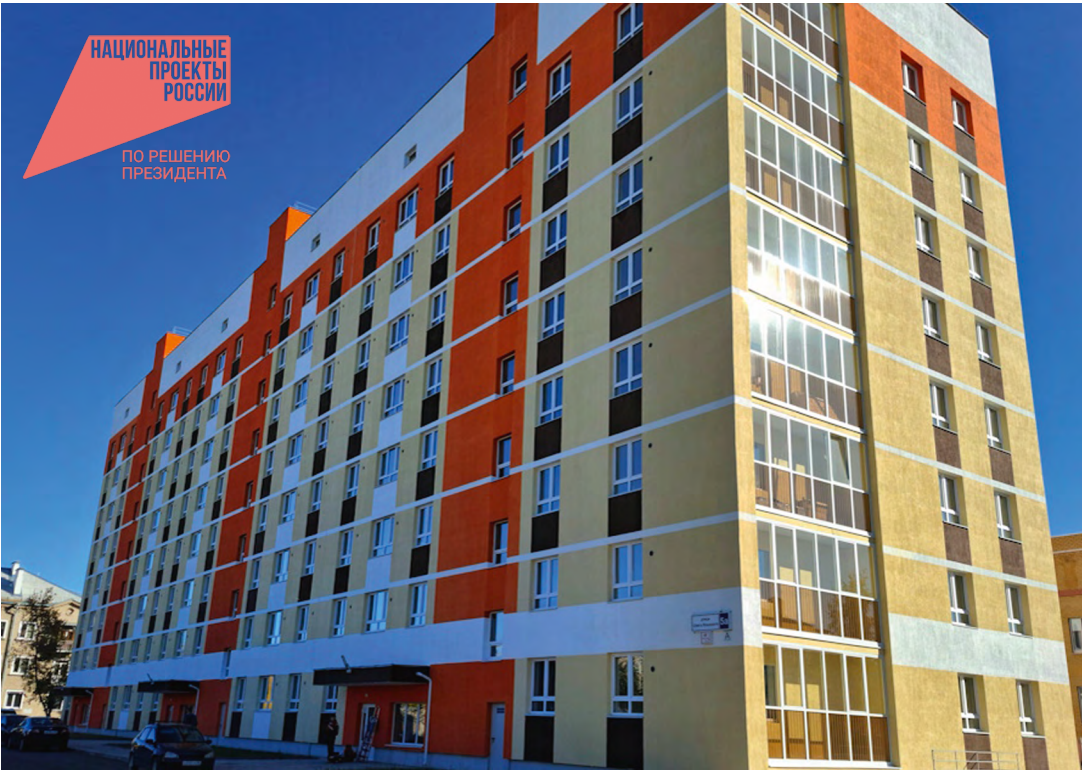
Получить жилье в собственность свердловским детям-сиротам становится проще

Как отмечает департамент информполитики Свердловской области, поддержка различных категорий граждан, включая детей-сирот, соответствует задачам национального проекта «Семья».