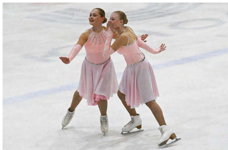
▲ Свердловские фигуристки покорили «Кубок Урала»