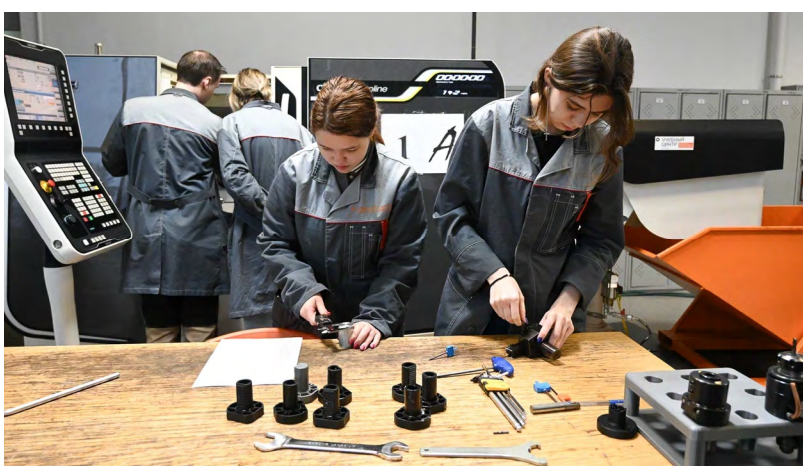
▲ Будущее рабочих кадров обсудили на Уральском образовательном форуме среднего профессионального образования