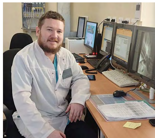
▲ Свердловские хирурги провели успешную операцию на сердце пациента