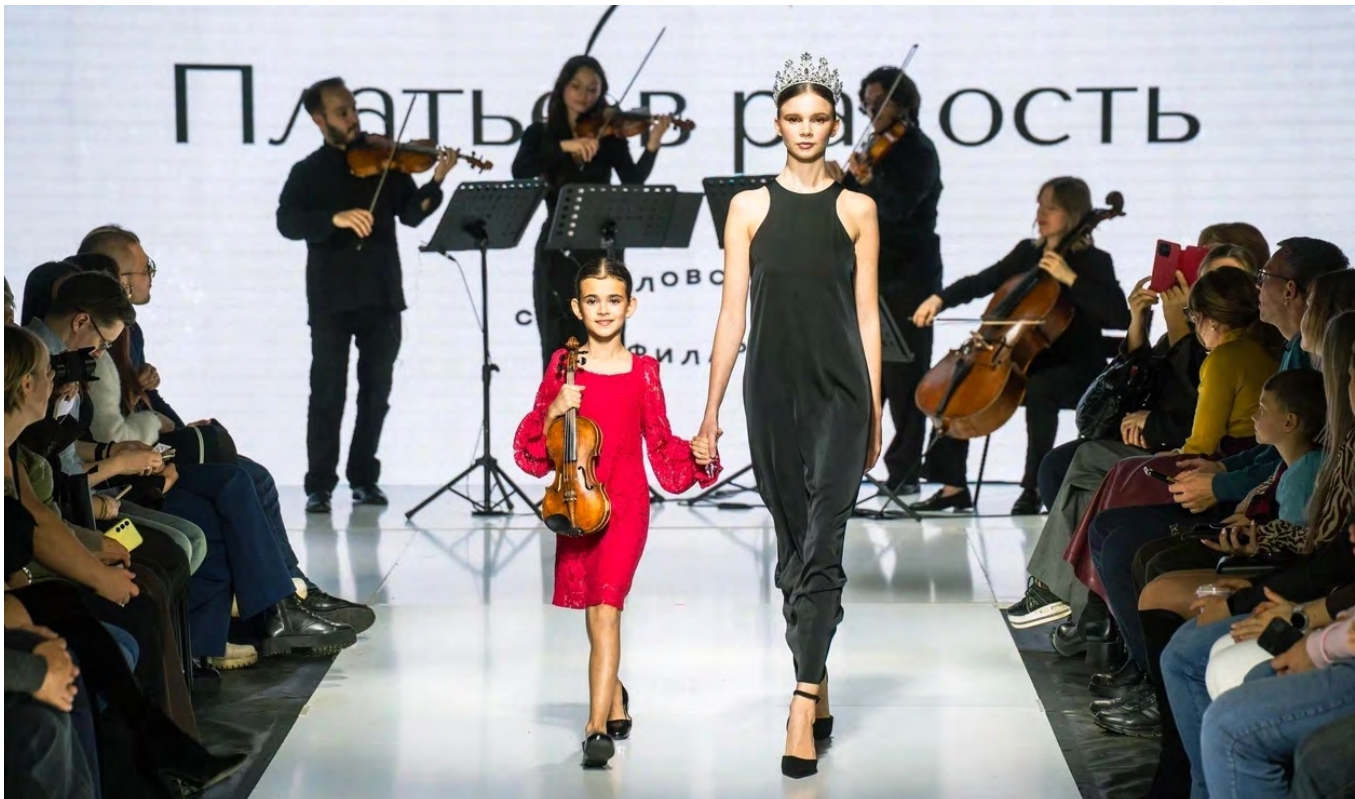
▲ Неделя моды и Филармония: стиль и музыка на одном подиуме