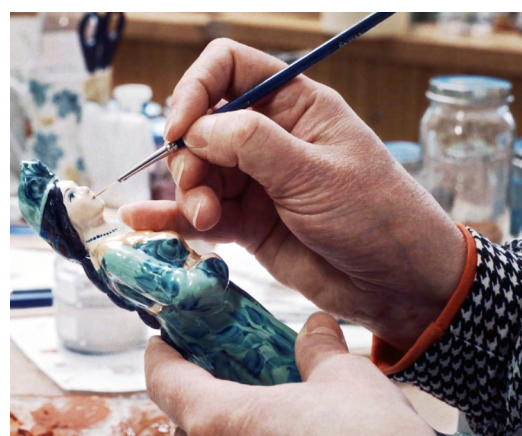
▲ Неделя уральского кино охватит шесть городов Свердловской области. Кадр из д/ф «Хрупкое»