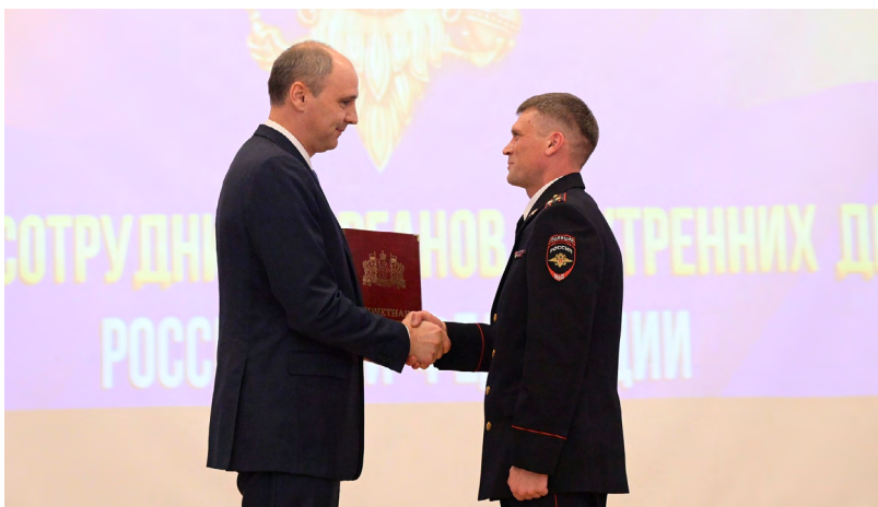
▲ Губернатор Денис Паслер поздравил сотрудников и ветеранов органов внутренних дел с профессиональным праздником