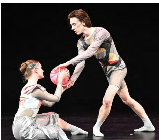
▲ На малой сцене ТЮЗа состоялся показ танцевального спектакля «Колесо времени» Уральского хореографического колледжа